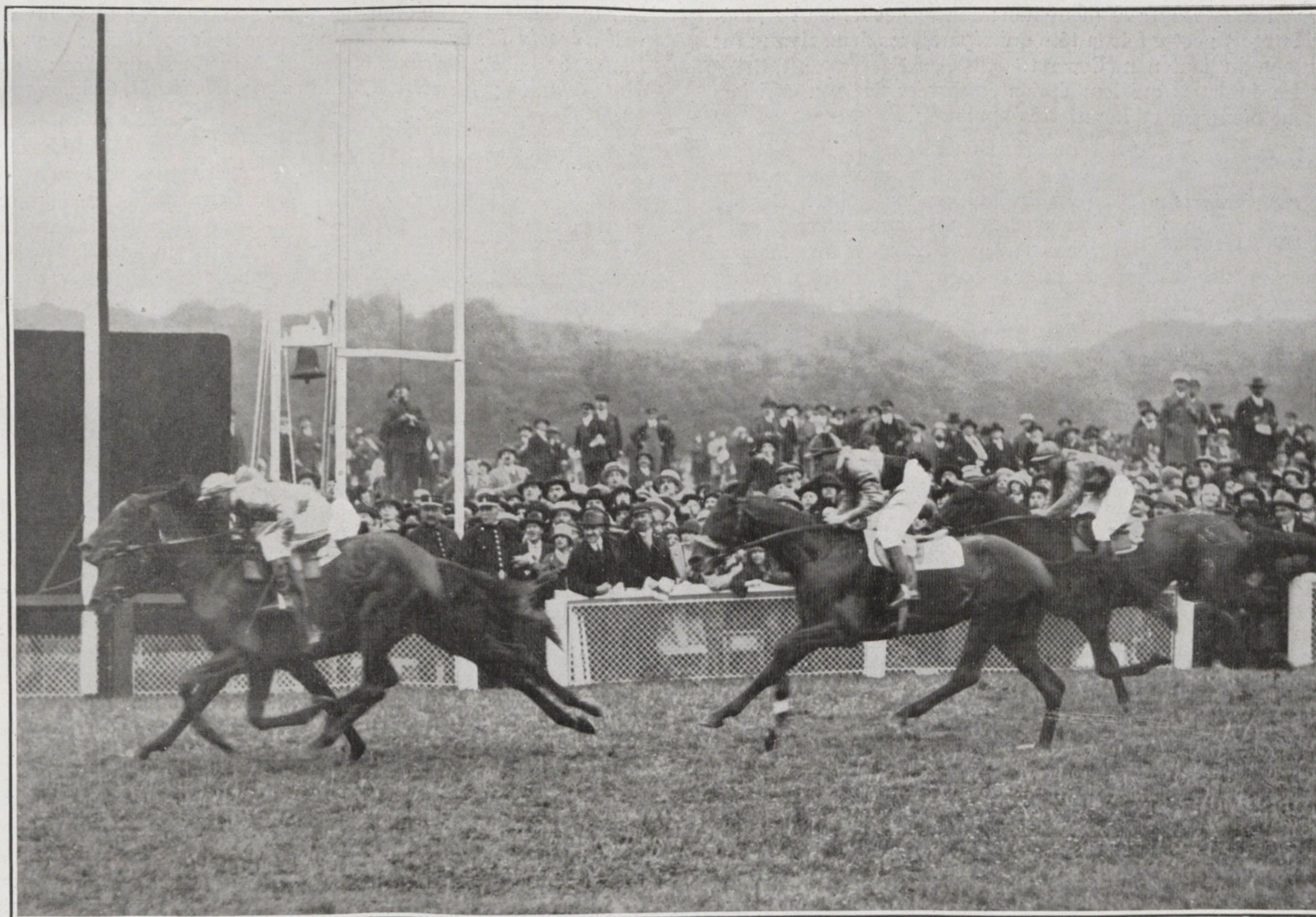
LONGCHAMP, 28 Juin. — L'arrivée du GRAND PRIX DE PARIS.

Après une lutte longtemps indécise REINE LUMIÈRE (C. Smirke) réussit à prendre une tête à TERRE-NEUVIEN (Mac Gee), DARK DIAMOND (Ferré) troisième devant EROFITE (Brethès).