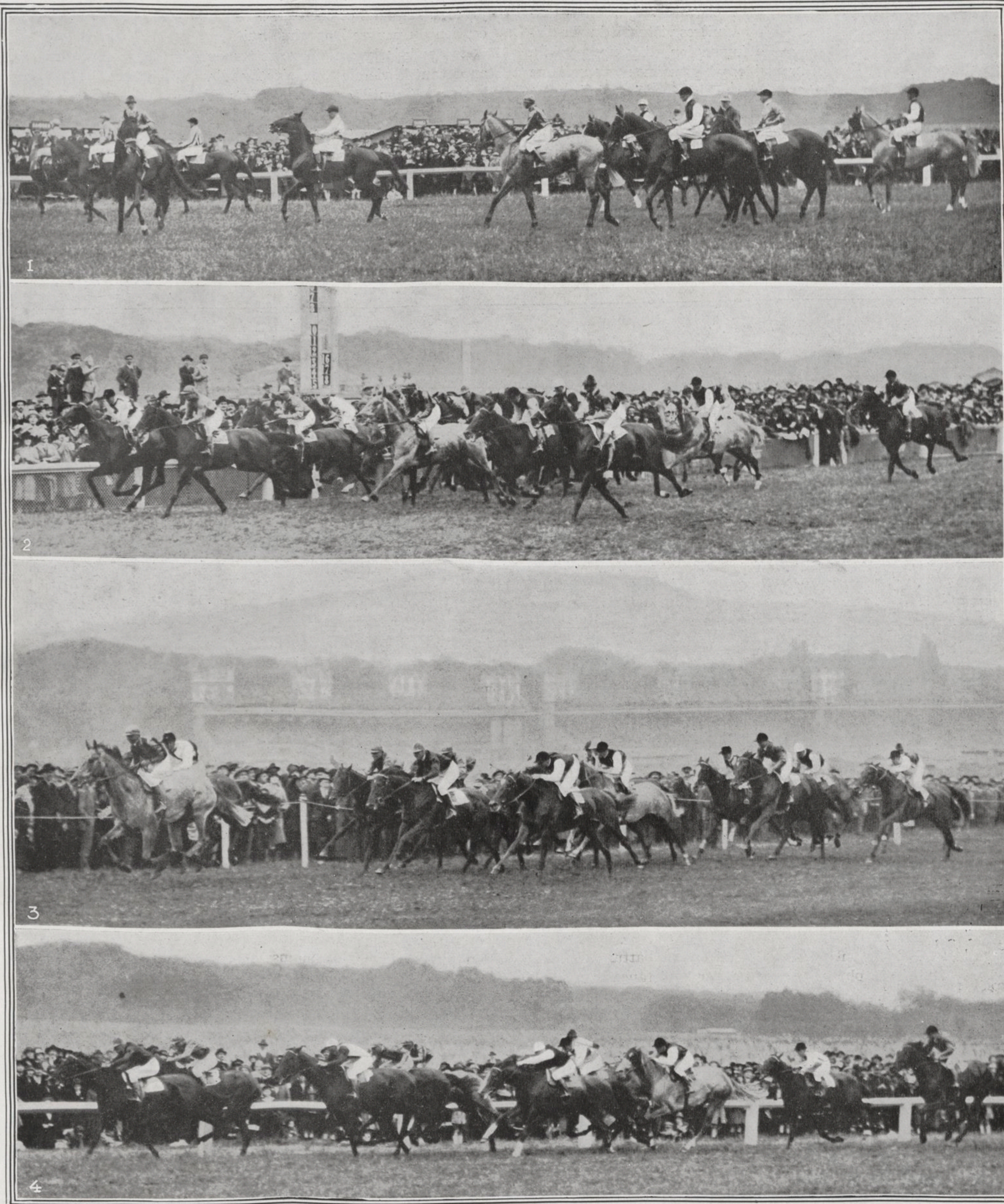
1. Les concurrents se rangent sous les ordres du starter. — 2. Au passage devant les tribunes, SAC A PAPIER mène devant EROFITE, REINE LUMIÈRE, CORAM, CHUBASCO, TRUSKMORE, DARK DIAMOND puis BELFONDS et PTOLEMY qui ferme la marche. — 3. Dans la montée, CHUBASCO est passé en tête devant SAC A PAPIER, EROFITE, TERRE-NEUVIEN, REINE LUMIÈRE, TRUSKMORE, BELFONDS, THE SIRDAR, SI SI, TOMY II, PTOLEMY, FONTENAI, PRIORI et DARK DIAMOND. — 4. Au milieu de la ligne droite, TERRE-NEUVIEN se sauve au poteau serré de près par REINE LUMIÈRE, puis viennent dans l'ordre, THE SIRDAR, EROFITE, CHUBASCO, FONTENAI, SAC A PAPIER, DARK DIAMOND, BELFONDS, PRIORI et PTOLEMY.